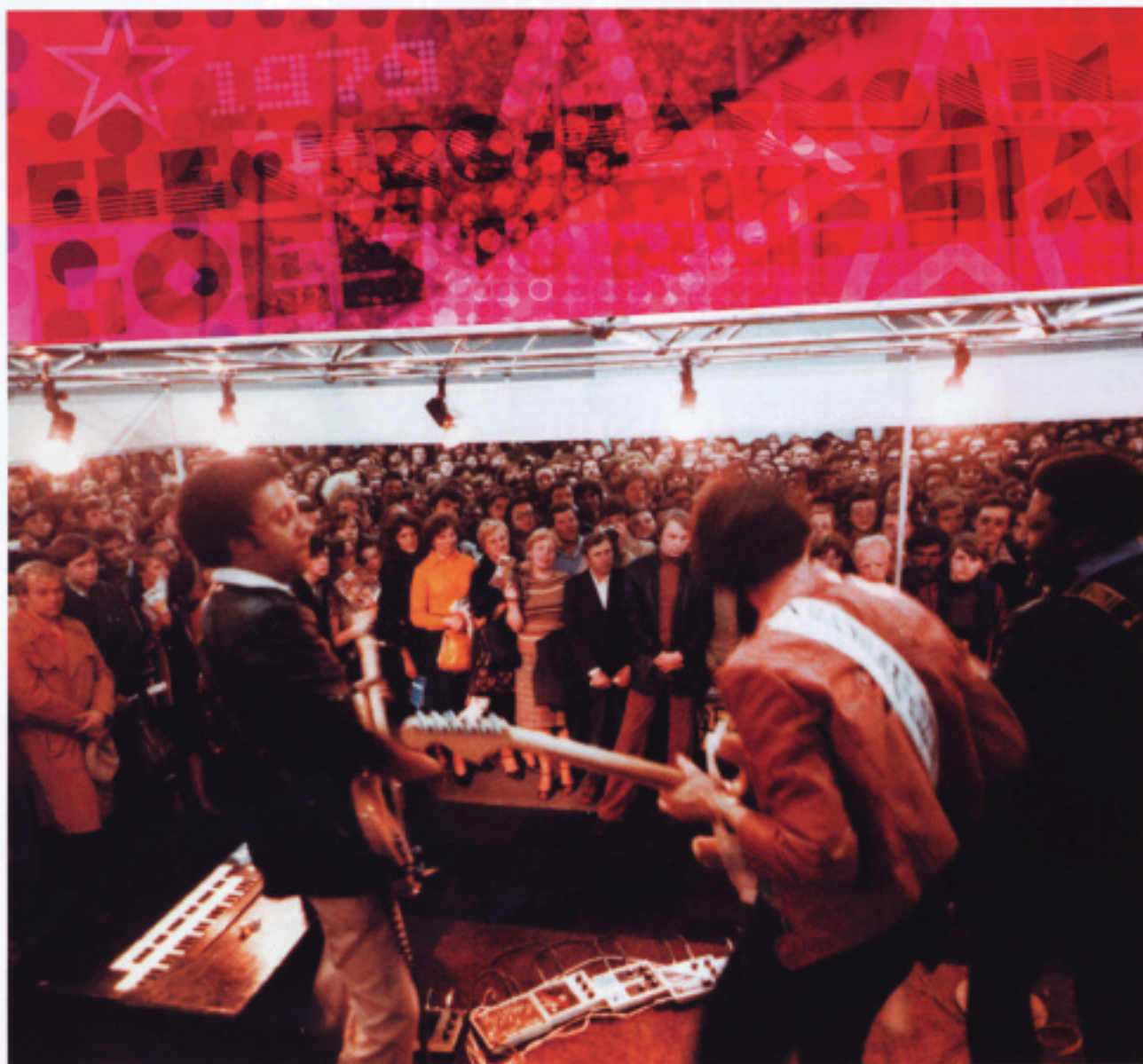
Во время выступления в СССР в 1979 году

лодежи 60-х. Он вовсе не был типичным хиппи. Кизи, собственно, начал эту революцию, будучи консерватором. Смотрите: он вернулся в Орегон, женился на девушке, которую любил со школы, и прожил с ней всю жизнь. Они вырастили троих детей, занялись фермерством. Помню, в конце жизни он выступал в нашей публичной библиотеке и говорил о пользе чтения. Что каждый школьник должен прочесть «Моби Дика». Никто не ожидал столь